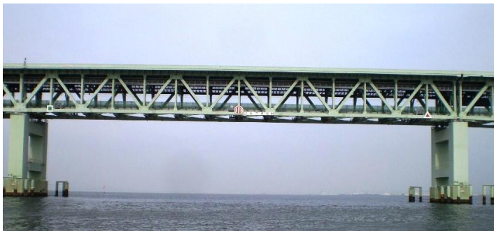
(写真 2) 通過ゲート全体