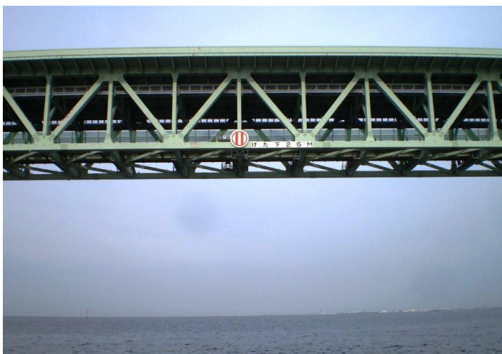
(写真 3) ゲート上部