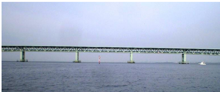
スタート・マークから コースの方向に見たゲートの写真